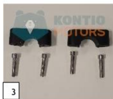
3 Tangon kiinnikkeet ja kiinnikeruuvit. (kuva 3).