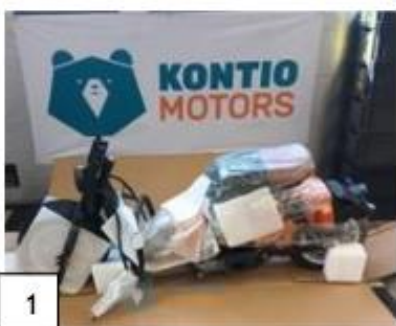
1 Kruiser Vesper runko osittain kasattuna. (kuva 1) Tarkista tehdas kiinnitteisten osien kiinnitykset.

Irto-osissa voi olla poikkeavaisuuksia riippuen valmistuserästä. Asennusohjeessa on käytetty Kontio Cruiser Elektraa , joten ohjeessa voi olla poikkeavuuksia. Kontio Cruiser Vesperin suojaamiseksi kuljetuksen aikana laite toimitetaan osittain kasattuna. Asenna ajoneuvo käyttövalmiiksi seuraavien ohjeiden mukaisesti. Avatessasi pakkausta varo, että pakkaus ei puhkea, jottei sisältö vaurioidu. Kun olet avannut paketin, tarkista, että seuraavat osat ovat mukana: