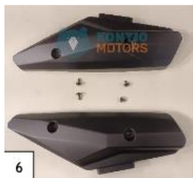
6 Kylkipaneeli. (kuva 6).