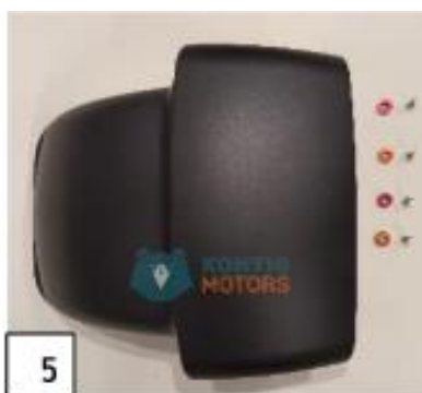
5 Etulokasuoja. (kuva 5).